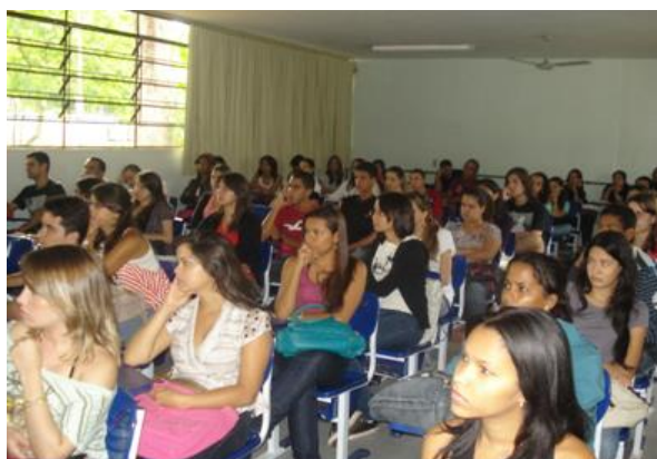
Primeiro dia da Recepção Calourosa Graduandos reunidos no Setor de Horticultura.

Nesta atividade os membros do Grupo Pet tiveram a oportunidade de exercitar a oratória através das apresentações feitas aos estudantes ingressantes, e ainda aprimorar as habilidades de planejar, escrever e organizar.