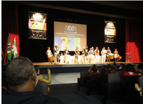
Apresentação Cultural do grupo Coró de Pau

Houve integração e troca intensiva de experiências entre os grupos PET do Brasil; desenvolveu-se a capacidade dos petianos do Estado de Goiás quanto a organização de eventos.