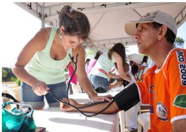
Petiana do PET Enfermagem aferindo pressão do ciclista