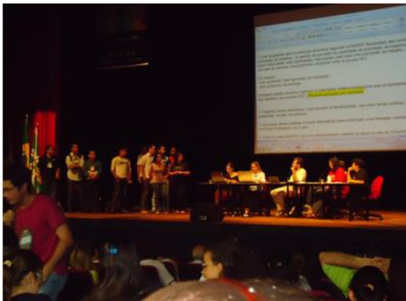
Assembléia Geral do ENAPET