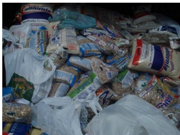
Alimentos arrecadados na inscrição