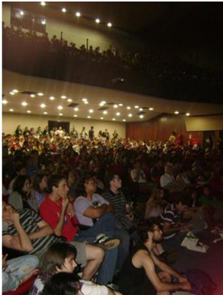
Visão Geral da cerimônia de abertura no Teatro SESI