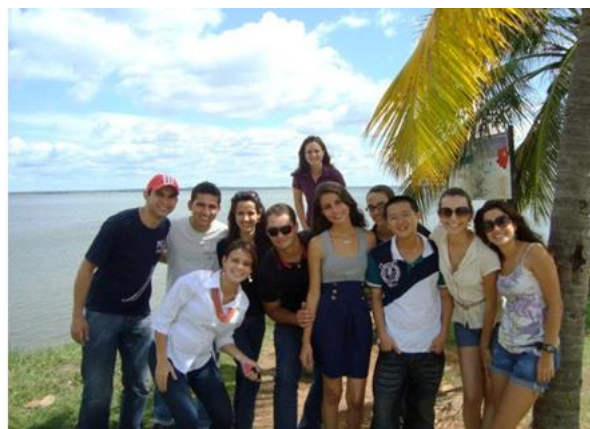
Congregação de petianos em frente a Praia da Canela – Palmas - Tocantins