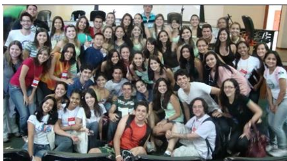
Petianos se reúnem no IX Encontro Centro-Oeste e Norte dos Grupos PET