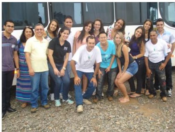
Grupo PET Engali, graduandos e professores na visita a COOPERAÇAFRÃO – Cooperativa de Açafião de Mara Rosa – Goiás.

Nesta atividade os membros do Grupo PET tiveram a oportunidade de estabelecer um contato com os produtores de açafião da região, ampliaram a seu conhecimento sobre esse produto e seus potenciais, conheceram a Cooperativa de Beneficiamento do Açafião, além de apresentarem o andamento de suas pesquisas em relação ao açafião.