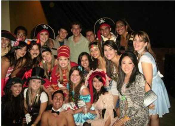
Festa Petiana a Fantasia realizada na Quinta Feira – XVI ENAPET