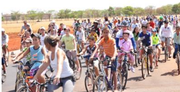
Ciclistas durante o percurso