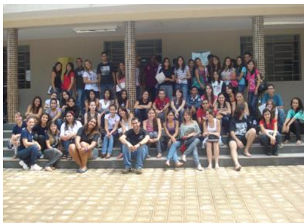
Momento de descontração em frente ao Prédio Central na Escola de Agronomia e Engenharia de Alimentos