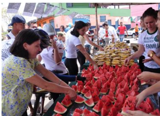
Lanche saudável após o Passeio Ciclístico